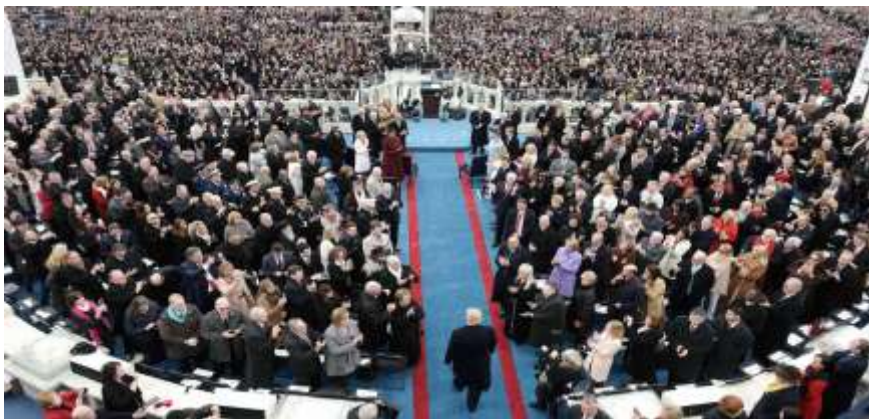
Donald Trumpin virkaanastujaiset Washingtonissa.

Kalle Haatanen: Populismien monet kasvot , linkki: https://areena.yle.fi/1-4422465