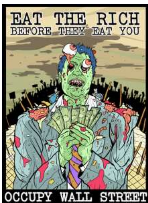
Näkökulma rikkaista ihmisistä

Muodostakaa pienryhmät ja tutkikaa, mistä poliittisesti liikkeestä Occupy-liikkeessä on kyse, mikä liikettä motivoi toimimaan, mitä he vastustavat ja mitä liikkeessä pyritään saavuttamaan? Miettikää myös mitä vastaan itse protestoisitte, miksi ja miten protestin toteuttaisitte? Valmistakaa protestistanne propaganda video tai mainos, jossa yllytätte muita mukaan toimintaan ja nimetkää liikkeenne? Tehtävässä tärkeää on ymmärtää kansalaisaktivismia synnyttäviä syitä ja sitä sisua mikä saa kansalaiset lähtemään kaduille, joka on maailmalla paljon yleisempää, kuin meillä täällä Suomessa sekä esiin tuoda niitä epäkohtia, joita itse haluaisitte maailmassa muuttaa. Alla Occypyn kaksi julistetta. Kuvat ovat vahvasti arvottuneita, miten ja mitä mieltä olette itse niistä?